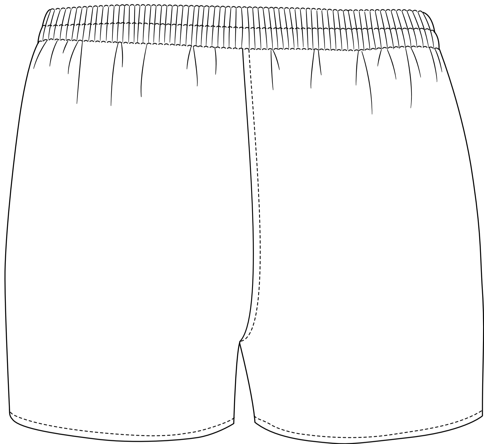
se středovým švem